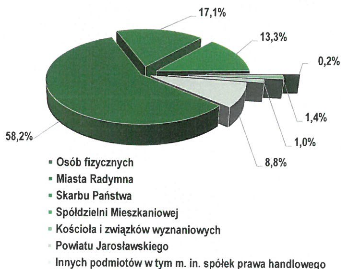
Struktura własności terenów miasta Radymna

Blisko 60 % obszaru całego miasta stanowi własność osób fizycznych, Miasto Radymno dysponuje 17 % powierzchni, zaś Skarb Państwa nieco ponad 13 %. Powiat Jarosławski włada gruntem stanowiącym 1 % ogólnego obszaru miasta i prawie pół % więcej jest w posiadaniu Kościoła i związków wyznaniowych.